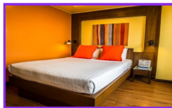
スーパーリアルム

豪華さはないものの、落ち着いた色調のモダンなインテリアが揃っており機能性が高いです。お部屋は全室LCDテレビが完備されています。