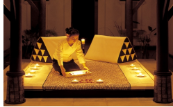
JWマリオットプーケット/メイン JWマリオットプーケット/客室 JWマリオットプーケット/「マン」

ロケーション: プーケット マイカオビーチ 5つ星のアイランドリゾートです。客室はバルコニーまたは屋内サラ(タイ式東屋)を備え、豊かなシルクのファブリックの他、快適かつ便利なアメニティをそろえています。