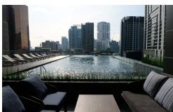
屋外プールプール