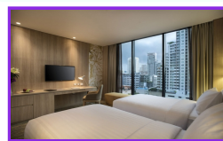
プレミア 30平米/バスタブなし