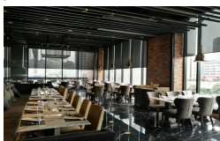
プライムプライムレストラン