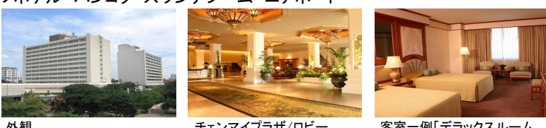
外観 チェンマイプラザ/ロビー 客室一例「デラックスルーム」

ロケーション: バンコク スワンナプーム国際空港 空港に行くにも、バンコク市内に行くにもとても便利です。会議室やビジネスセンターの設備も完備し、観光だけでなくビジネスにも最適です。また、24時間ルームサービスなどサービス内容が充実しています。