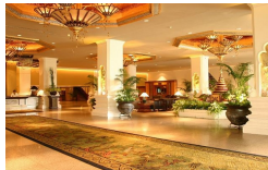
チェンマイプラザ/ロビー