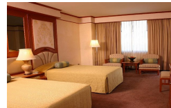
客室一例「デラックスルーム」

ロケーション: バンコク スワンナプーム国際空港 空港に行くにも、バンコク市内に行くにもとても便利です。会議室やビジネスセンターの設備も完備し、観光だけでなくビジネスにも最適です。また、24時間ルームサービスなどサービス内容が充実しています。