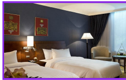
バンコク: スーペリアルーム

チェックインの時間に規定はなく、24時間以内ならいつでもチェックアウトが可能です。