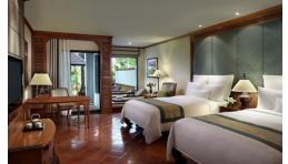
デラックス テラス (+¥4,500) お部屋の広さ: 47平米