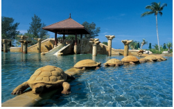
JW Marriott プークェット/キッズ