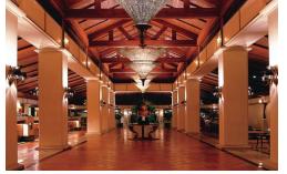
JW Marriott プークェット/ロビー