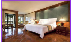
デラックス ガーデンビュー お部屋の広さ: 47平米

インテリアのファブリックは全てジムトンプソンオリジナルシルク! 静かなマイカオビーチに位置し、落ち着いた雰囲気の中で非常にゆったりとリラックスした時間をすごすことができます。