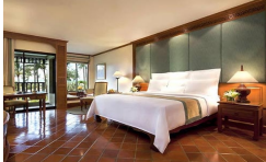
デラックス プールテラス (+¥9,000) お部屋の広さ: 47平米